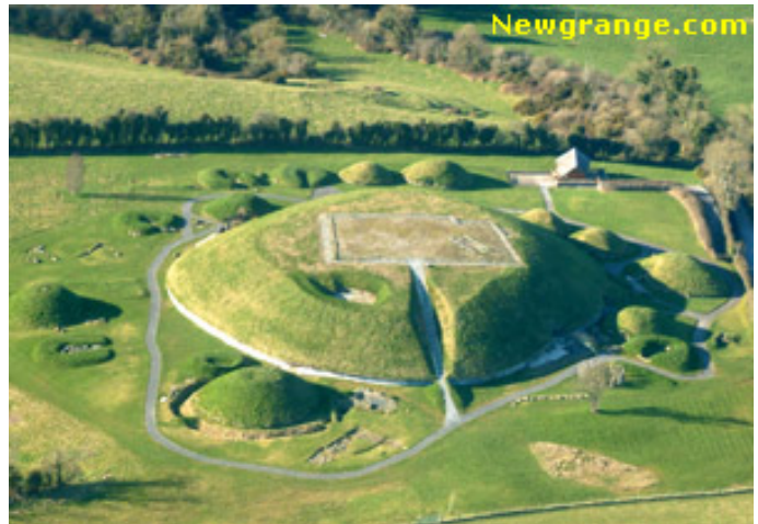
Knowth van boven, met huisfundamenten.

opstanding van Christus door de aarde heen kunnen waarnemen, doordat zij zagen dat de binnen-aarde door de opstanding geheel en al veranderde. Dit inspireerde de Kelten zeer, en zij hadden hierdoor hun eigen vorm van Christendom, wat ook doorstraalde tot in de 9 e eeuw naar Schotland en Brittannië, waar de Keltische mysterieplaatsen door de Romeinen en later door de Germanen waren verwoest. Avalon, in de buurt van Glastonbury, had een directe meditatieve verbinding met deze plek, en de mensen leerden hier door de elementen en de deze dragende wezens heen, zich af te stemmen op een gebouw in Knowth, waar zij in hun toen nog jonge ik werden gesterkt. Ze werden er ontvangen door zes mannelijke en zes vrouwelijke priesters, die hen in hun ik zagen, waardeerden en aanmoedigden diens krachten ook actief in de wereld te gaan gebruiken. Overigens gebeurde dit in een houten gebouw voor de heuvel, gebouwd rond een ander sterk instromingspunt dat voor de ik-cultus werd gebruikt. De wijdelingen werden voor twee zuilen gevoerd, die je beide kon indrukken. Degene die niet terugveerde, de meer mannelijke, was een voorbereiding op de latere wetenschap; degene die terugveerde,, de meer vrouwelijke, met de latere kunst. Zij werden erop gewezen dat beide richtingen tot ware religie