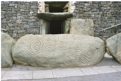
Ingangssteen bij Newgrange.

klauteren, heeft naast de afbeelding van de in- en uitspiraliserende gang van de zon, ook de graving van drie spiralen naar een centrum. Dit duidt erop, dat hier in het midden iets nieuws