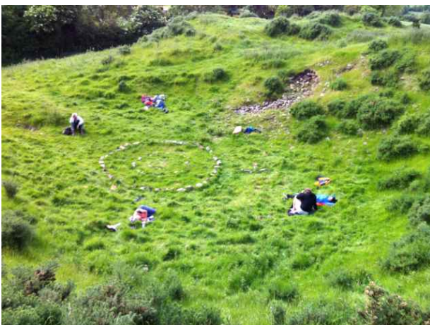
Uitrusten na het werk in de kom bij Dowth.

De drie erop volgende dagen deden we met behulp van muziek de zogeheten lotusbloemendans,