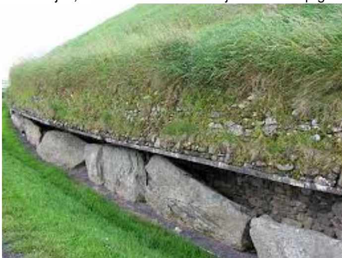
Knowth, ring met kerbstones, met aan beide zijden inscripties en tekeningen. Hebben ook de andere 2.

voerden. Deze ervaringen maakten diepe indruk op de jonge mensen-ikken en -zielen die daar kwamen. De twee stenen aan de oostelijke ingang van Knowth geven de dualiteit man-vrouw weer in de meer fallische aanduiding voor de lente-evening, de ronde steen als vrouwelijke ernaast. Rond Knowth was de aarde-school, dus hoe je als Keltische wijdeling om kon leren gaan met Moeder Aarde, haar elementen en ook elementwezens. De Keltische priesters, druïden (dwz. 2 e graads ingewijden in de wijsheid), hadden hier hun opleiding, nadat deze in Anglesey, Noord Wales, door de Romeinen in de 5 e eeuw was verwoest. Deze buurt werd door Rudolf Steiner aangeduid als het centrum van de Hybernische mysteriën, die vanwege de