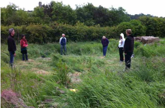
Waarnemen bij het transformatiepunt.

Zeven mensen, waaronder een Amerikaanse en een Duitse, begonnen aan een week werken op het transformatiepunt, nadat we eerst de oude heiligdommen hebben bezocht en poolhoogte genomen van de situatie en sfeer in de levens- en astrale werelden. Er was veel leed gebeurd in deze buurt, mede omdat het zo'n belangrijke buurt was voor Ierland, en, naar later bleek, voor de wereld. Hiervan hebben we vooral tijdens het werk in de onderaardse sferen veel moeten omvormen en bevrijden. Belangrijk was dat binnen onze groep de verhoudingen man-vrouw in evenwicht was, drie vrouwen op vier mannen. Dat wekt altijd mooi balancerend.