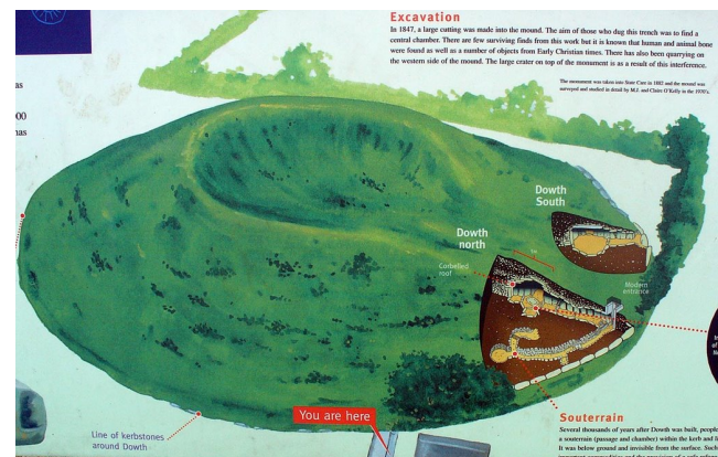
Dowth, schema. Afgelaten in de 17 e eeuw.

Bij ons vooronderzoek namen we in Dowth op het uitstromingspunt als eerste waar dat de elementwezens hier waren afgesneden van hun uitwisseling met de geestelijke sferen, en daardoor zaten er ook veel overleden mensenzelen vast die niet bevrijd konden worden. Ook meldden zich twee koningen uit vroeger tijden. De eerste stamde uit de 3 e eeuw na Chr. Van hem was de legende bekend gebleven dat hij op deze plek een toren naar de hemelen wilde bouwen. Daartoe had hij alle sterke mannen onder zijn bewind uitgenodigd, en zijn zus had hij gevraagd de bewegingen van de zon tegen te houden zodat de dag aanhield tot de toren af zou zijn. Doordat hij met zijn zus sliep, verbrak de betovering en keerden de bouwers huiswaarts zonder de toren af te krijgen. Je zou dit verhaal ook kunnen zien in het kader van de ik-versteviging in het lichaam, waardoor er niet makkelijk een uitstroom naar de geestelijke wereld kon plaats vinden (wat later in Egypte met de mummificering werd geperfectioneerd). De tweede koning was veel ouder, uit de late steentijd. Hij had schuldgevoel doordat hij niet had kunnen voorkomen dat de tempel was verwoest, waarin de werkingen van de thymuslotusbloem werden gehuldigd, die het etherhart in de mens aanlegt: het was door toenmalige priesters niet als impuls opgepakt, en daardoor in vergetelheid geraakt. Hij had hierdoor net zozeer schuldgevoel als zijn latere pendant.