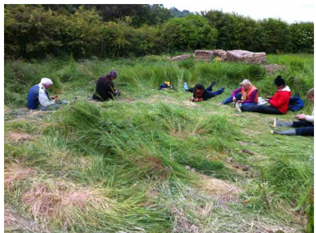
Boetseren van innerlijke gebaren.

In de 9 e ondersfeer, die van de tegen-seraffijn die in haat leeft, brachten we een lichtkruis binnen in de van haat donker gekleurde sfeer. Moeder Aarde gaf instemming met ons werk, en de landschapsengel zoog de hierdoor ontstane lichtbol als een zegening in zich op. Hierna maakten welk een kleibeeldje met een gebaar dat we vanuit een van de onderaardse sferen schonken