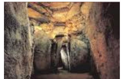
3-ledige kamer met gang, Knowth (ook in Newgrange).

In de 10 e eeuw hebben de Noormannen deze mysterieplaats verwoest, zodat sindsdien de Keltische mysteriën geen vast aangrijpingspunt meer hadden, en verstrooiden in brokjes kennis en wijsheid. Onze waarnemingen op Avalon tijdens ondersferenwerk aldaar toonden dat deze verstrooiing, en vooral de moderne