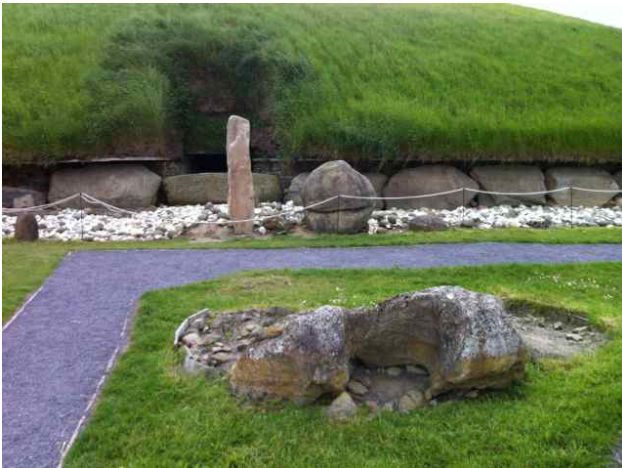
Knowth, westelijke ingang met een mannelijke en een vrouwelijke steen.

Door hier te gaan ordenen met ondersferenwerk en het inbrengen van de voor Ierland relevante sterrenbeeld-idealen, af te sluiten met de lotusbloemendans waarin de kiemen voor de toekomstmens worden ingewerkt in het land, hoopten we meer orde en rust te brengen door deze centrale plekken te bevrijden van haar gevallen engelen, en meer op de toekomst af te stemmen met onze vorm van esoterisch Christendom. Dit mede aangezien de Keltische volksziel zich heeft geofferd voor dit esoterische Christendom (waarbij de Griekse volksziel zich offerde voor de