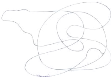
De deva wekt voorzichtig de zompheus, tekening S. Hermet

Hierna zijn we de verschillende punten gaan zoeken (zie de kaart), en bij het leverpunt beleefden we een slapende reus in de modder op de kwelder, een soort zompheus, die nauwelijks wakker kon worden en op dat moment niet door ons wilde worden gewekt, waarbij ik veel verdriet beleefde om alle leed die op het eiland door mensen aan elkaar was aangedaan.