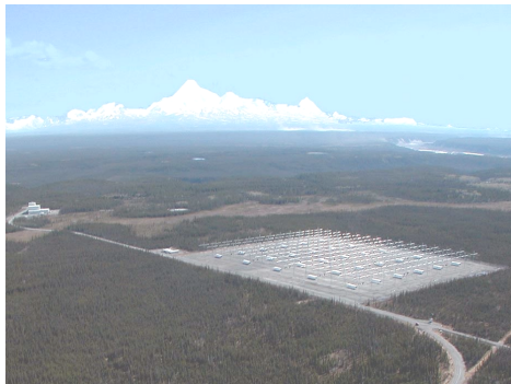
De zendinstallatie te Gakona, Alaska.

Dit speeltje heet HAARP, een afkorting van Highfrequency Active Auroral Resonance Project. 1 Er worden hoogfrequente, en tegenwoordig ook laagfrequente elektromagnetische stralen de hoge atmosfeer en ook de aarde in gestuurd. Het zijn uitgebreide zendinstallaties. Uiterlijk vrij onaanzienlijk en ongevaarlijk; er is geen activiteit