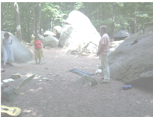
De lotusbloemendans in het Odenwald; sterk helend werk door indansen van onze hogere geestesgaven in het landschap.

Daarnaast is het natuurlijk belangrijk om ook het grote publiek voor de negatieve effecten van het doodzwijgen van chemtrails en HAARP te blijven wakker te maken, dus dat de media beïnvloed worden. Deze lijken nu juist doof te zijn voor HAARP en chemtrails.