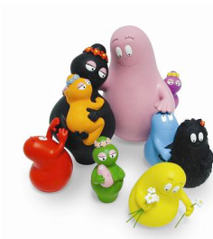
Barbapappa en familie.

verder ontwikkelen, maar nog geen grote vernieuwende daden verrichten. Daarnaast waren ze erg ontvankelijk gebleken voor de werkingen van het boze, zodat ze niet geschikt waren om het boze zelf te verlossen of om te vormen. De te vroeg geïncarneerde mensen kennen wij als de neandertaler; deze had een sterke beleving aan het hiernamaals (hun doden kregen veel voorwerpen mee), maar was wat grover en logger dan de huidige mens. Die was toen nog niet dusdanig uitgehard en uitgevormd zodat wij hier resten van zouden kunnen vinden.