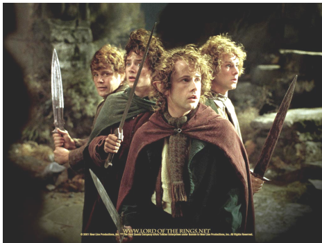
De vier hobbits in de film.