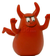
Een 'boze' barbapappa.

door de sterren ook, nadat hij de balrog, een vuurdemon, heeft verslagen. De mensen zijn de nog niet geheel volgroeide Barbapappa's, die hun weg door de dikke nevelige soep op aarde dienen te vinden; hun koninklijke geslacht, de Dunédain, waarvan Aragorn de laatste loot is, heeft al wel een verder ontwikkeld lichaam met meerdere vaardigheden, waaronder een langer leven (zij zijn overlevenden van een eiland dat in de richting van de engelwereld lag, maar dat door hoogmoed en de intrige van Sauron, een helper van het hoogste boze, ten onder is gegaan). Deze mensen konden dus enkel