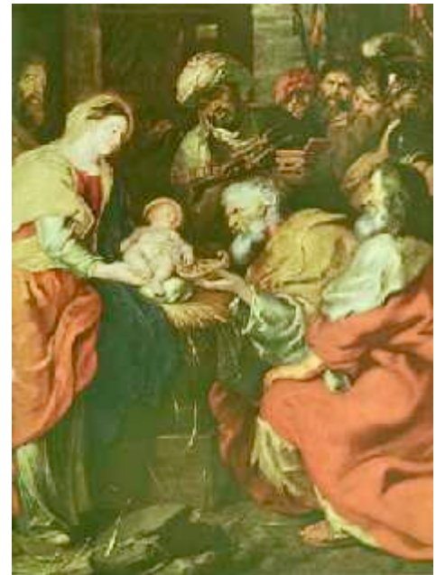
Rubens: 'Aanbidding der Koningen'

De derde Maria, Maria Magdalena, was de zus van Lazarus/Johannes en van Martha. Zij was naast leerling ook vrouw van de latere Christus die in Jezus incorporeerde (gedurende de laatste drie jaar van diens leven). 12 Haar incarnatielijijn gaat terug naar die van de eerste dochter van Adam en Eva, Norea; deze werd door de tegenmachten, de archonten in de duisternis gezet maar kon daar, beschermd als ze was door Moeder Sofia in haar, goed tegen. 13 In dit licht wordt ook begrijpelijk waarom Christus eerst zeven geesten uit haar drijft; zij is geworpen in de duisternis, dat wil zeggen daar waar de werkwereeld van het leven is waarin onze (voor het bewustzijn duistere) wil weeft en werkt. Deze uitdrijving is dus voor Maria Magdalena tevens haar inwijding. Hieraan wordt meteen duidelijk dat deze Maria het wilsaspect van Moeder Sofia vertegenwoordigt; iets wat in de huidige cultuur van de bewustzijnsziel en erna meer en maar naar buiten zal kunnen komen. Dit is weer een ander aspect van de Moeder; ik wil me hier echter focussen op de andere twee, die tot in de recente geschiedenis samen een belangrijke rol hebben gespeeld.