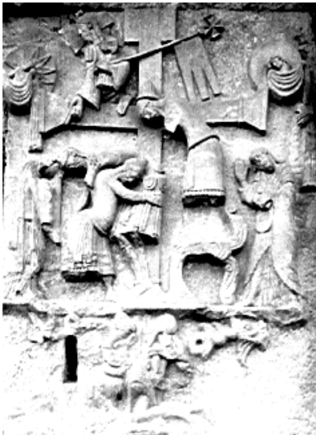
Reliëf van de kruisafname bij de Externsteine.

De sterrenbeelden van de dierenriem staan aan de hemel als de geestelijk-astrale oerbeelden, waarin nog steeds de Cherubijnen huizen en die als het oerbeeld van Adam Kadmon nog steeds op de aardse mens inwerken, zij het zijdelings; de mens moet vanuit zijn hogere wezen weer naar die sterren toe kunnen groeien. En het hogere deel van zijn ik, dat de kiemen van zijn geestmens in zich draagt, is op de zon achtergebleven. Vandaar dat het zinvol is om over de siderische dierenriem te spreken met betrekking tot zonne-horoscopie; de siderische standen geven uitsluitel