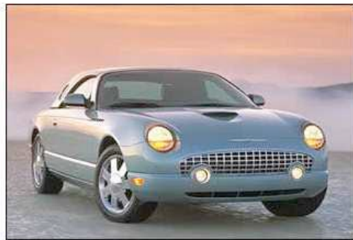
Boven: Ford A, 1903 Onder: Ford T-Bird, 2002

Aldus kun je trachten een voorwerp te maken met behulp van inzicht in elk van de vier levensbereiken als wer-kingsvelden, die het gebaar van wat men wil bereiken al deels in zich hebben; aanvankelijk rudimentair,