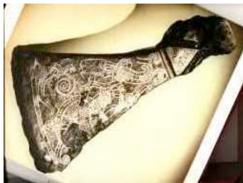
Germaanse bijl met inscripties en levenskrachtpatronen

In vroeger tijden, in onze streken van de Kelten en Germanen, was elk voorwerp voorzien van heilige inscripties, die de werkingen ervan begeleidden. Bezig zijn met dat voorwerp was een ritueel gebaar, want de goden en levenswerkingen die erop waren weergegeven, in voorstellingen en schrifttekens, werkten ook daadwerkelijk mee met het gebaar. Het duistere tijdperk, pas begin 20e eeuw afgesloten, heeft die verbinding met de godenwereld verbroken - althans voor het menselijke bewustzijn. Nu hebben we daardoor ons individuele bewustzijn in en aan de fysieke wereld kunnen ontwikkelen. De wetenschap onderzoekt de natuur, de kunst wat er in de natuur is te beleven. En de religie (wat betekent 'herverbinden') zo die in de Westerse wereld nog bestaat en wordt beleden, is een cultus op zichzelf die de ziel en geest aan spreekt, maar niet meer met de dagelijkse handelingen te maken heeft - hooguit wordt men zich meer bewust van de dagelijkse handelingen en hun nut in het grotere geheel.